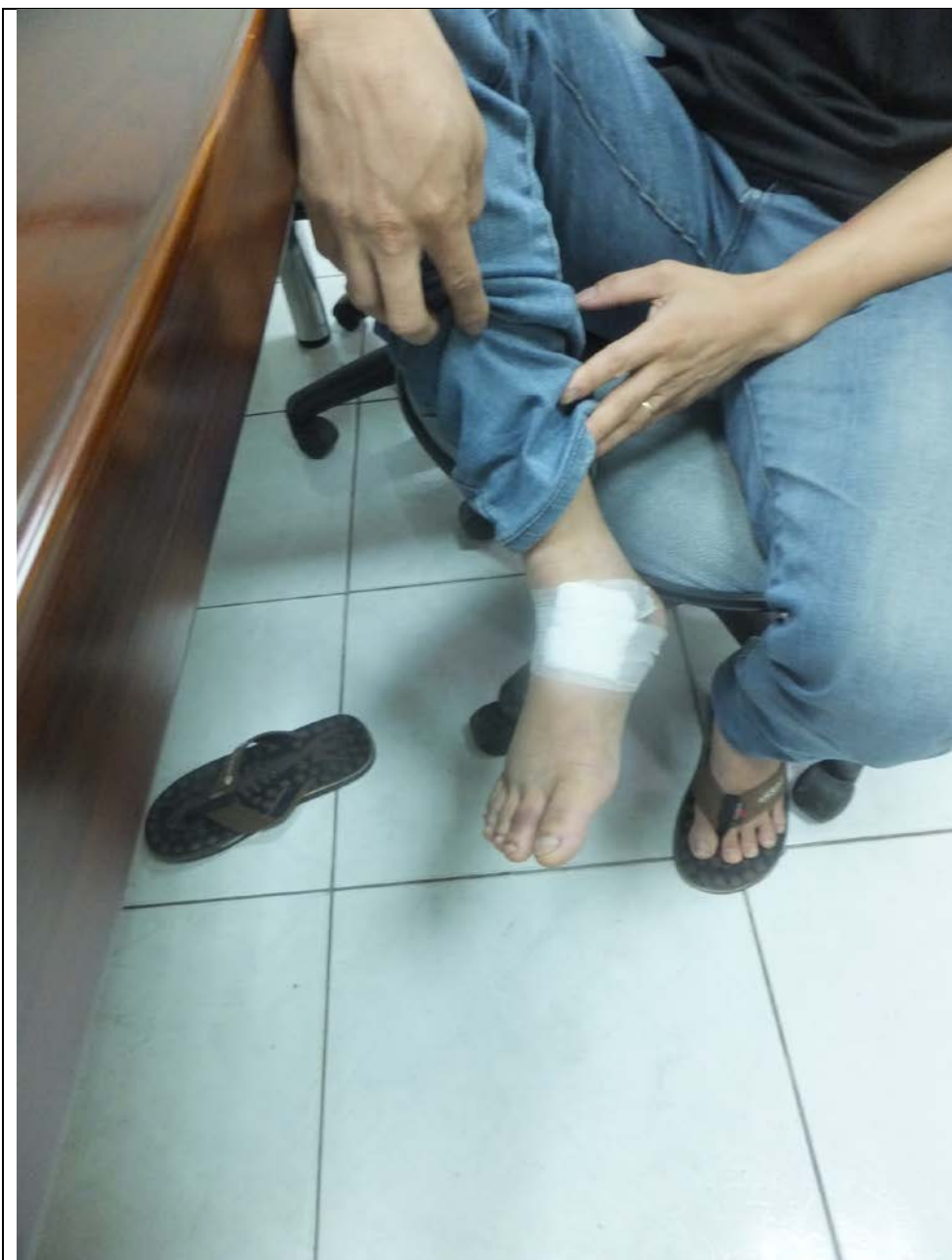
說明：罹災者受傷部位照片。