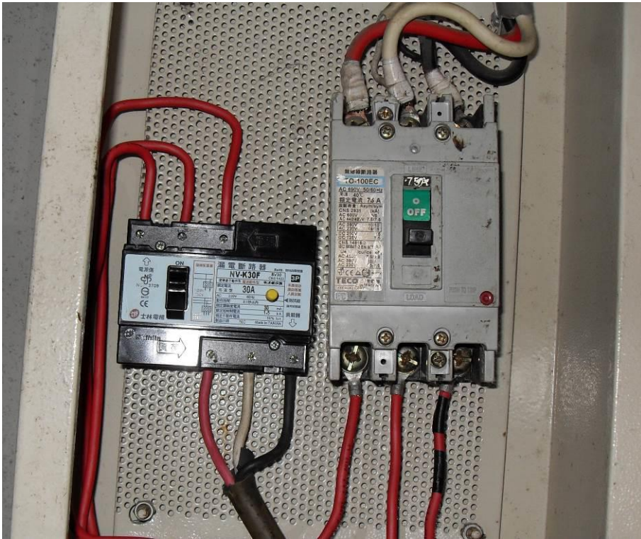
說明：應於空氣壓縮機之連接電路上設置漏電斷路器。