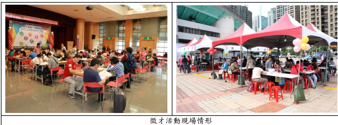
徵才活動現場情形