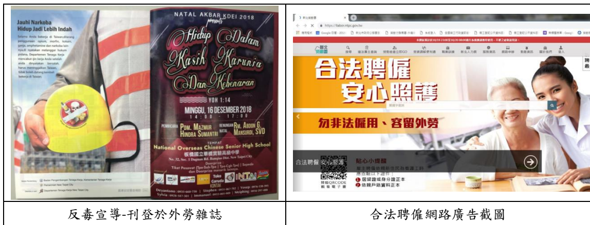
反毒宣導-刊登於外勞雜誌