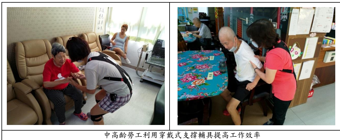
中高齡勞工利用穿戴式支撐輔具提高工作效率