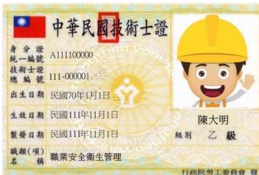
圖 1 安全衛生教育訓練講師證明 (參考)