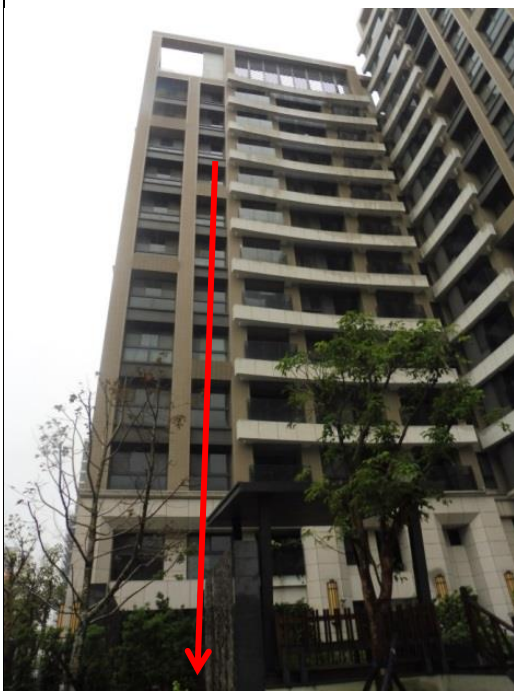
災害現場照片說明

雇主提供勞工使用之安全帶或安裝安全母索時，安全帶之材料、強度及檢驗應符合國家標準 CNS 7534 Z2037 高處作業用安全帶、CNS 6701 M2077 安全帶（繫身型）之規定。（營造安全衛生設施標準第23條第1項）